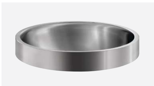
Vasque à poser RAVA Inox Réf. DELABIE : 120670

Le Groupe DELABIE, expert des équipements sanitaires pour les lieux publics, complète sa gamme de produits sanitaires en Inox avec sa nouvelle vasque à poser RAVA. En Inox 304 poli satiné ou Téflon® noir mat, elle associe design épuré et robustesse pour les ERP. Durable, hygiénique et résistante à l'usage intensif, elle s'intègre parfaitement aux projets hôteliers, culturels ou tertiaires. Elle offre une solution élégante et fiable pour les sanitaires publics.