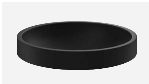
Vasque à poser RAVA noir mat Réf. DELABIE : 120670BK